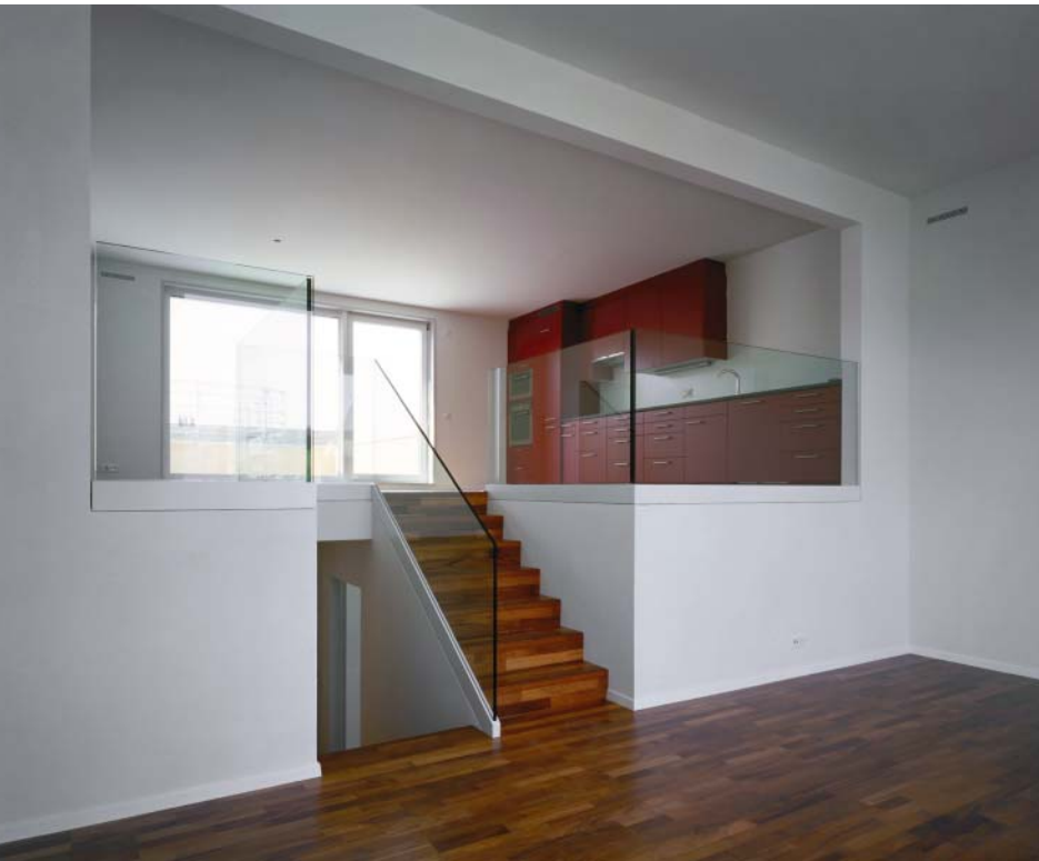
Durch Niveausprünge und bewusst gesetzte Öffnungen wurden spannende Raumsequenzen kreiert.